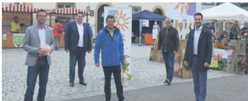
Die Bürgermeister des Schweinfurter Mainbogen beim Marktumgang