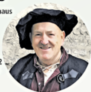
Historischer Förderkreis Gochsheim-Weyer e. V.

Veranstalter/Anmeldung: Historischer Förderkreis Gochsheim/Weyer e.V. Am Plan 2, 97469 Gochsheim Telefon 09721 630323 info@reichsdorfmuseum.de