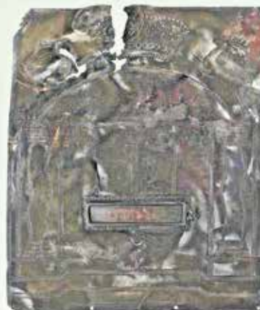
"Inscription auf den Gesetzestafeln im Thoraschild in der Tass: Die Anfangsbuchstaben der Zehn Gebote"