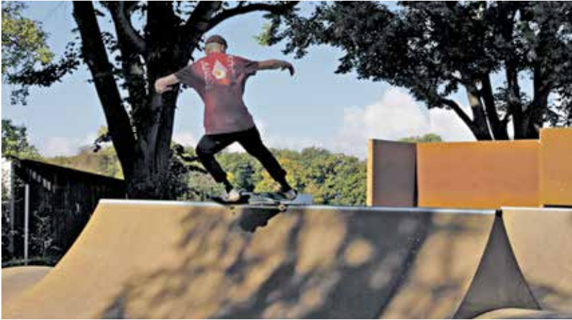
Skateranlage Sennfeld

Wir haben für eure Ferien zuhause einen guten Tipp: Habt ihr schon mal unsere Skateranlagen in den Mainbogengemeinden getestet? Pakt eure Räder und los geht's. Die Ferien sind lang! Verbringt doch eure Freizeit in Gochsheim, Grafenrheinfeld, Grettstadt, Röthlein, Schwebheim und Sennfeld. Hier stehen euch unterschiedliche Gerätschaften wie Mini-Ramps mit Spine und Wellen, Bank to Bank mit Rail und Ledge, Hip mit Ledge und