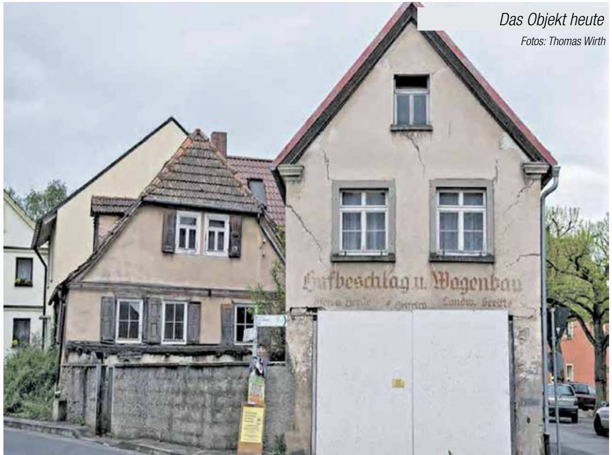
Das Objekt heute

Nachdem die verschiedenen Vorschläge durch die jeweiligen Teams ausgearbeitet wurden, fand am Samstag, den