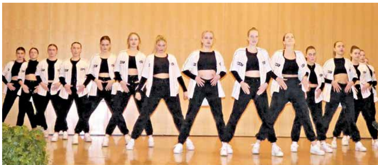
Tanzgruppe ID Dance Sensation der Tanzschule „Tanz an“ aus Schwebheim. Deutscher Meister des „Dance Masters“ von Dettlef D. Soost.