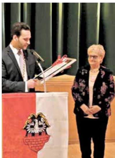
Urkundenübergabe Ehrentitel „Altbürgermeisterin“