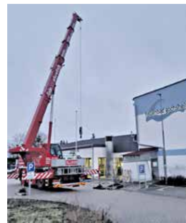
Einheben der neuen Lüftungselementen