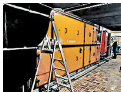
Neue Lüftungsanlage vor der Inbetriebnahme

Gochsheim, 24.01.2023 Hallenbad Gochsheim gez. Christoph Schwaab Technischer Betriebsleiter