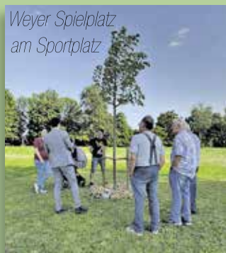
Weyer Spielplatz am Sportplatz