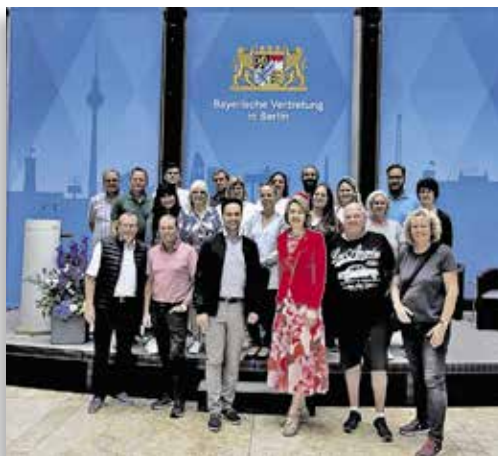
Bay. Vertretung Berlin