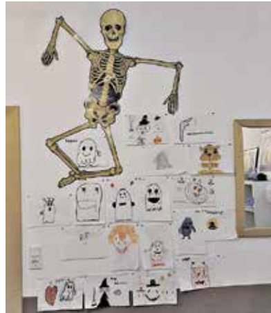
Anbei ein paar Ergebnisse und Impressionen unserer Aktionen und der Party Liebe Grüße aus dem Jugendtreff

Die beiden vorausgegangenen Wochen standen übrigens auch schon unter dem Zeichen Halloween. So hatten unsere Besucher in einer Woche die Möglichkeit eine möglichst gruselige Maske zu gestalten, in der anderen Woche stand Kürbisse schnitzen auf dem Plan.