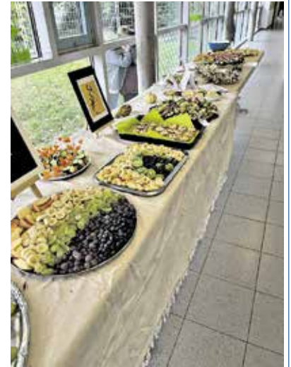
Text und Bilder: Sylvia Kneuer