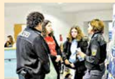
Stark frequentiert, besonders auch von Mädchen: der Info-Stand von Polizei und Bundespolizei.

Vertreten waren die Bauunternehmen Riedel, Glöckle und Böhner Bau, die Logistikunternehmen Geis, Pabst und Röhlein Logistik, Mainfrucht, Kräuterhaus Wild, Semco Glastechnik, die Fahrzeugfirmen Beständig, Schuster, Pfister und BMW Heermann& Rhein, Fensterbau Finstral, Volkmar Maschinenbau, Edeka Didis, Bosch Rexroth, Trips, Stadt und Landkreis Schweinfurt, Feuerwehr Ständige Wache, Polizei, Bundespolizei, Bundeswehr, FIS Informationssysteme, Mainbogenpraxis und aus den Pflegebereichen AWO Schwebheim, Diakonisches Werk, BeneVit Haus Mainbogen, die Berufsfachschule für Ernährung und Versorgung und die Berufsfachschule für Kranken- und Kinderkrankenpflege.