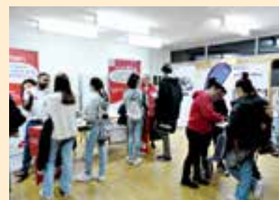
Bei allen Pflegeberufen herrscht momentan großer Bedarf. Die Jugendlichen ließen sich über unterschiedliche Zugangswege informieren.