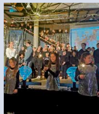
Zum Finale kamen alle Mitwirkenden nochmal auf die Bühne und lieferten ein glitzerndes Schlussbild.

Nach der Show sorgt der Elternbeirat im Pausenhof für die Verköstigung der Gäste und eine Lasershow am Nachthimmel.