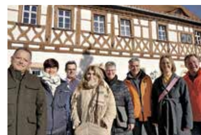
Der neu gewählte Vorstand