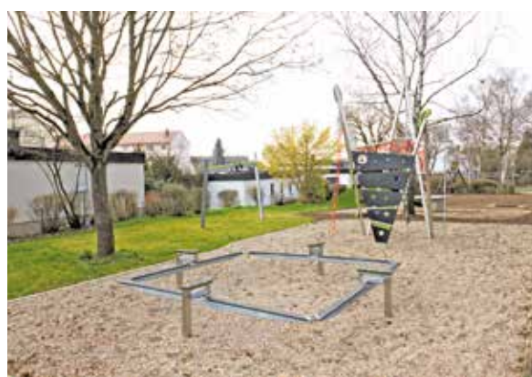
Manuel Kneuer Erster Bürgermeister