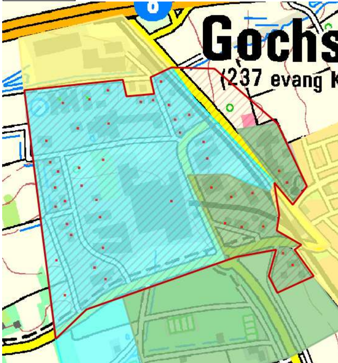
Karte 1: Erschließungsgebiet nach Markterkundung