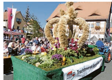
Der erste Festwagen trug die traditionelle Erntekrone, die wieder kunstvoll vom Trachtenverein gebunden wurde.